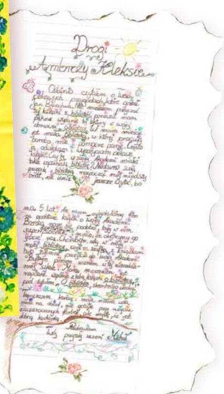
autor_Michał Zięba (10 l.)