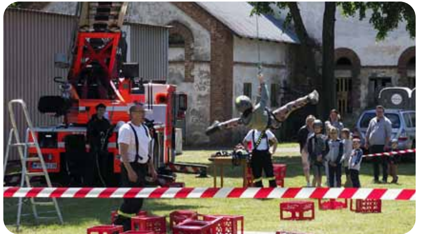
PIKNIK STRAŻACKI / 3 czerwca / Brwinów