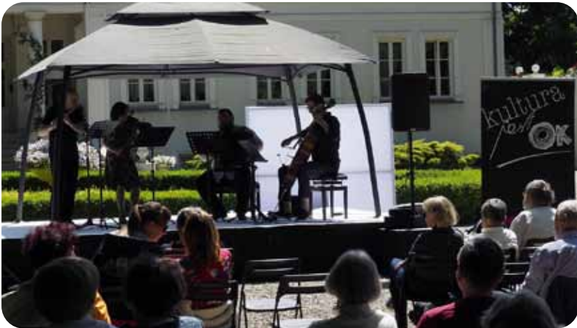
CUP OF TIME / 3 czerwca / Pałac Żółtwin

FESTIWAL OTWARTE OGRODY / Fotorelacja na OK.BRWINOW.PL