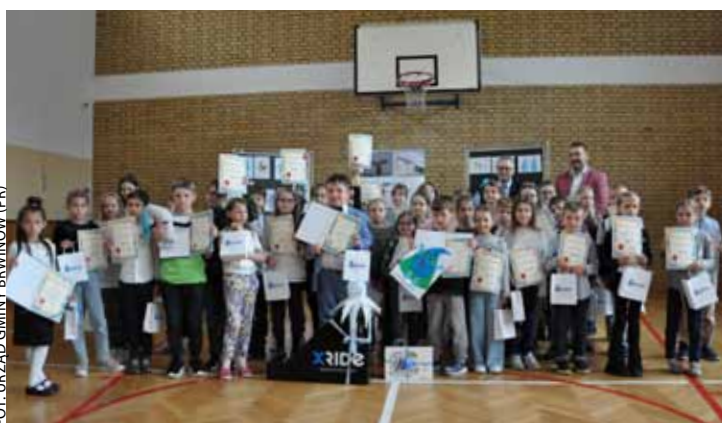
Na zdjęciu: wszyscy uczestnicy konkursu, którzy przyjechali do Żółwina na oficjalne jego zakończenie.