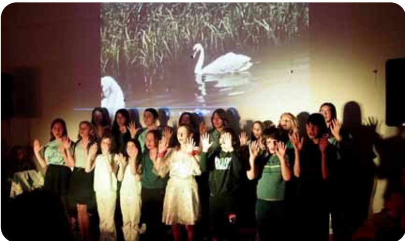
NIĘŚMIERTELNY PTAK / 3 czerwca / Przychodnia Kulturalna w Otrębusach