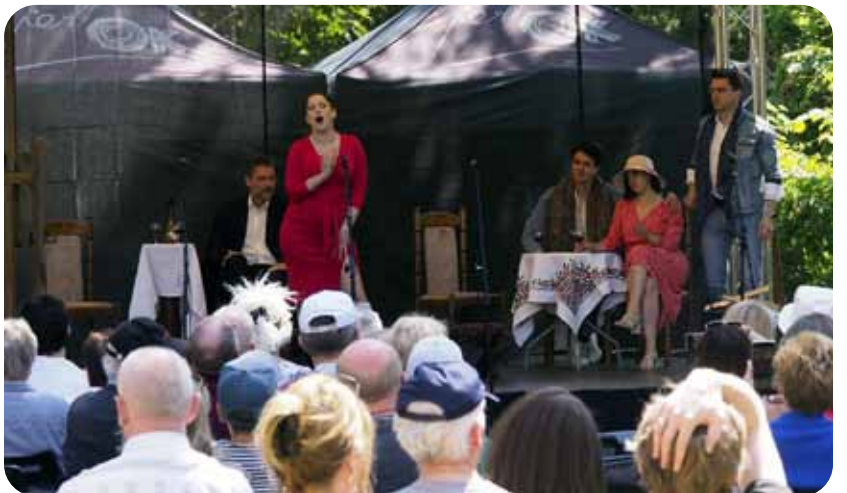
MUZYKA, TANIECI ŚPIEW WŚRÓD ZIELENI / 4 czerwca / Ogród Wernerów w Brwinowie